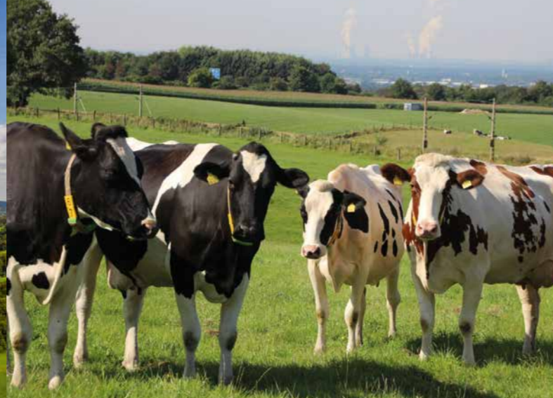
Gut Ellscheid, Haan