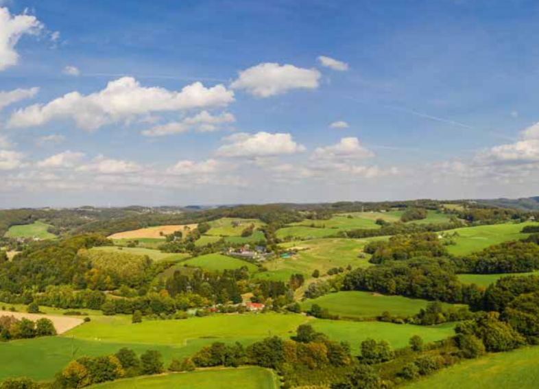
Panorama bei Velbert-Neviges

H.I.N. Touristik GmbH | Tel. 02104-927990 info@hin-touristik.de | hin-touristik.de